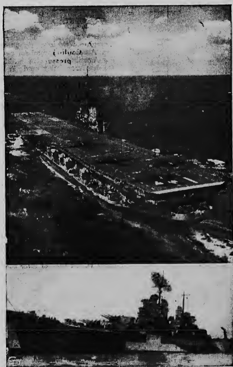
De 45,000-ton vliegdekschip MIDWAY (boven), die naar Singapo- re zou vertrekken, werd naar Formosa gedirigeerd om zich te voe- gen bij de 7de Amerikaanse Vloot, waarvan de kruiser PITTSBURGH (beneden) ook deel uitmaakt.